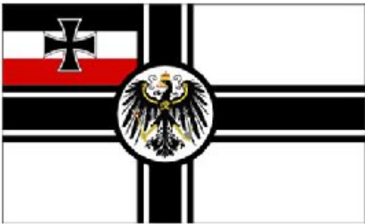
Die kaiserliche Kriegsflagge – 26. September 1903

Im Jahr 1903 hisste ein russisches Kriegsschiff, das auf ein deutsches traf, versehentlich die britische „White Ensign“ anstelle der deutschen Kriegsflagge zum Gruß, was damals als große Beleidigung galt. Dies führte schließlich dazu, dass der deutsche Kaiser Wilhelm II. die Kriegsflagge erneut änderte. Er ordnete an, das schwarze Skandinavische Kreuz und die schwarze Randlinie der Mittelscheibe erheblich zu verbreitern. Auch die schwarze Randlinie sollte durchgehend dargestellt werden.