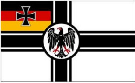
Angenommene Kriegsflagge – 27. September 1919 (nie verwendet)

Die Führung der deutschen Marine war immer noch konservativ und akzeptierte das neue republikanische Design nicht. Sie weigerten sich, die neue Version zu hissen und bestanden auf der weiteren Verwendung der alten Reichskriegsflagge des Deutschen Reiches. Aus diesem Grund wurde das republikanische Design – obwohl es in gewissem Umfang hergestellt wurde – nie auf einem deutschen Kriegsschiff oder anderswo verwendet und gehisst. Die Marine zeigte weiterhin die kaiserliche Kriegsflagge. Am 1. Januar 1922 löste ein völlig neues Design die Kriegsflagge des Deutschen Reiches ab.