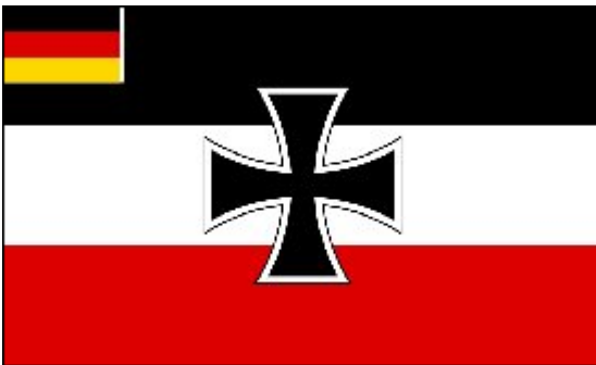
Deutsche Kriegsflagge – 1. Januar 1922

Die Führung der deutschen Marine war immer noch konservativ und akzeptierte das neue republikanische Design nicht. Sie weigerten sich, die neue Version zu hissen und bestanden auf der weiteren Verwendung der alten Reichskriegsflagge des Deutschen Reiches. Aus diesem Grund wurde das republikanische Design – obwohl es in gewissem Umfang hergestellt wurde – nie auf einem deutschen Kriegsschiff oder anderswo verwendet und gehisst. Die Marine zeigte weiterhin die kaiserliche Kriegsflagge. Am 1. Januar 1922 löste ein völlig neues Design die Kriegsflagge des Deutschen Reiches ab.