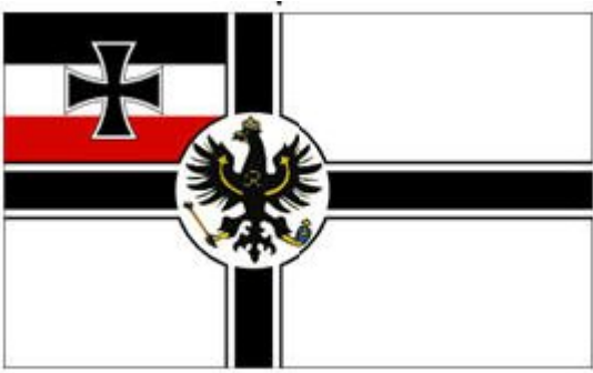
Die kaiserliche Kriegsflagge - 1871

Obwohl die Kriegsflagge ursprünglich nur als Seeflagge gedacht war, wurde 1892 beschlossen, dass sie auch die offizielle Flagge der deutschen Armee an Land sein sollte. Möglicherweise aufgrund dieser Änderung, wahrscheinlich aber auch einfach aus künstlerischen Gründen, erhielt die Flagge am 19. Dezember 1892 einen neuen Adler.