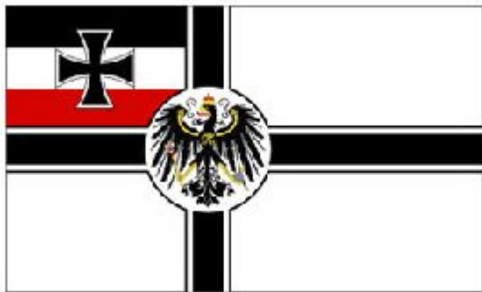
Die kaiserliche Kriegsflagge - 19. Dezember 1892

Obwohl die Kriegsflagge ursprünglich nur als Seeflagge gedacht war, wurde 1892 beschlossen, dass sie auch die offizielle Flagge der deutschen Armee an Land sein sollte. Möglicherweise aufgrund dieser Änderung, wahrscheinlich aber auch einfach aus künstlerischen Gründen, erhielt die Flagge am 19. Dezember 1892 einen neuen Adler.